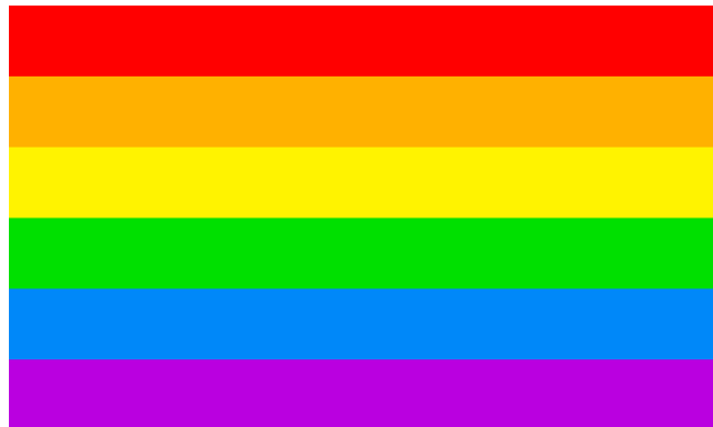
Die Regenbogenfahne (Darstellung 6, siehe Quellenverzeichnis)

1978 entwarf der amerikanische Künstler Gilbert Baker die Regenbogenfahne. Sie soll ein Symbol für lesbischen und schwulen Stolz darstellen, sowie gleichzeitig die Vielfalt dieser Lebensweise. Jede der Farben hat eine Bedeutung und ursprünglich waren acht Farben geplant. Noch heute ist, neben dem rosa Winkel und der roten Aids – Schleife, die Regenbogenfahne das internationale Zeichen der Lesben und Schwulen. Man trifft sie in jeder Form an, besonders aber an Veranstaltungen wie dem CSD.