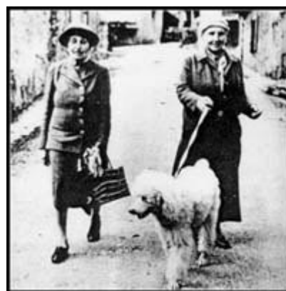
Gertrude Stein und Alice B. Toklas (Darstellung 1, siehe Quellenverzeichnis)

Sie lebte skandallos und selbstverständlich mit ihrer Lebensgefährtin Alice B. Toklas zusammen. Es existierten in Paris Buchläden und Literatenkaffees, in denen sich die Gruppe lesbischer Künstlerinnen um Gertrude Stein regelmässig traf.