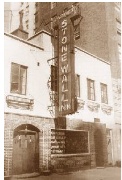
Stonewall Inn an der Christopher Street

„Während es bis dahin um die Entkriminalisierung von Schwulen und Lesben ging und darum, für Toleranz bei der heterosexuellen Bevölkerungsmehrheit zu werben, steht seit dem Aufstand ein neues Selbstbewusstsein im Vordergrund: Schwule, Lesben und Transgender sind stolz auf sich selbst, ihre sexuelle Orientierung oder Geschlechtsidentität und ihren Lebensstil und machen diesen Stolz (gay pride) auch selbstbewusst öffentlich“ 3